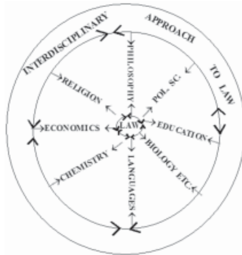
ਚਿੱਤਰ 1.3 ਸਮਾਜ ਵਿਗਿਆਨ ਵਿਸ਼ੇ 'ਕਾਨੂੰਨ' ਦੀ ਹੋਰਨਾਂ ਵਿਸ਼ਿਆਂ ਉੱਪਰ ਅੰਤਰਨਿਰਭਰਤਾ।

ਵਿਸ਼ਾ ਪ੍ਰਕਿਰਤੀ ਵਿੱਚ ਅੰਤਰ ਅਨੁਸ਼ਾਸਨੀ ਹੈ, ਕਿਉਂਕਿ ਜਦੋਂ ਅਸੀਂ ਇਤਿਹਾਸ ਦਾ ਅਧਿਐਨ ਕਰਦੇ ਹਾਂ, ਅਸੀਂ ਕਈ ਹੋਰ ਸਮਾਜ ਵਿਗਿਆਨ ਦੇ ਵਿਸ਼ੇ, ਜਿਵੇਂ ਕਿ ਆਰਥਕ ਇਤਿਹਾਸ, ਰਾਜਨੀਤਕ ਇਤਿਹਾਸ, ਮਨੋਵਿਗਿਆਨ ਦਾ ਇਤਿਹਾਸ, ਸਮਾਜ ਸ਼ਾਸਤਰ ਦਾ ਇਤਿਹਾਸ, ਧਾਰਮਿਕ ਇਤਿਹਾਸ ਆਦਿ ਦਾ ਇਤਿਹਾਸ ਵੀ ਪੜ੍ਹਦੇ ਹਾਂ। ਇਸ ਤੋਂ ਵੱਧ ਕੇ ਕਈ ਗੈਰ-ਸਮਾਜ ਵਿਗਿਆਨ ਵਿਸ਼ੇ ਜਿਵੇਂ ਕਿ ਭੌਤਿਕ ਵਿਗਿਆਨ ਦਾ ਇਤਿਹਾਸ, ਭਿੰਨ ਭਾਸ਼ਾਵਾਂ ਦਾ ਇਤਿਹਾਸ ਆਦਿ ਦਾ ਇਤਿਹਾਸ ਵੀ ਇਤਿਹਾਸ ਦਾ ਭਾਗ ਨਿਰਮਤ ਕਰਦੇ ਹਨ। ਇਸੇ ਤਰ੍ਹਾਂ ਸਮਾਜ ਵਿਗਿਆਨ ਵਿਸ਼ੇ 'ਸਮਾਜ ਸ਼ਾਸਤਰ' ਨਾਲ ਸੰਬੰਧਤ ਮੁੱਦਿਆਂ ਨੂੰ ਅਰਥ ਸ਼ਾਸਤਰ, ਸਿੱਖਿਆ, ਰਾਜਨੀਤੀ, ਵਿਗਿਆਨਕ ਵਿਕਾਸ, ਭਾਸ਼ਾ ਅਤੇ ਸਾਹਿਤ ਆਦਿ ਨੂੰ ਵਿਚਾਰਿਆਂ ਬਗੈਰ ਅਧਿਐਨ ਨਹੀਂ ਕੀਤਾ ਜਾ ਸਕਦਾ। ਇਨ੍ਹਾਂ ਇਤਿਹਾਸ ਅਤੇ ਸਮਾਜ ਸ਼ਾਸਤਰ ਵਾਂਗ ਸਮਾਜ ਵਿਗਿਆਨ ਦਾ ਹਰੇਕ ਵਿਸ਼ਾ ਅਧਿਐਨ ਦੇ ਉਸੇ ਖੇਤਰ ਅੰਦਰ (ਭਾਵ; ਸਮਾਜ ਵਿਗਿਆਨ ਦਾ ਖੇਤਰ), ਨਾਲ ਹੀ ਹੋਰਨਾਂ ਖੇਤਰਾਂ ਦੇ ਵਿਸ਼ਿਆਂ ਨਾਲ (ਭਾਵ ਭੌਤਿਕ ਵਿਗਿਆਨ, ਗਣਿਤ, ਜੀਵ ਵਿਗਿਆਨ ਆਦਿ) ਅੰਤਰ ਨਿਰਭਰਤਾ ਅਤੇ ਅੰਤਰ ਸੰਬੰਧਨ ਰੱਖਦਾ ਹੈ। ਪ੍ਰੰਤੂ ਸਮਾਜ ਵਿਗਿਆਨ ਦਾ ਇੱਕ ਵਿਸ਼ਾ ਆਪਣੇ ਅਧਿਐਨ ਦੇ ਖੇਤਰ ਅੰਦਰ ਹੋਰਨਾਂ ਵਿਸ਼ਿਆਂ ਨਾਲ ਵਧੇਰੇ ਸੰਬੰਧਨ ਰੱਖਦਾ ਹੈ। ਜਦਕਿ ਇਹ ਅਧਿਐਨ ਦੇ ਹੋਰਨਾਂ ਖੇਤਰਾਂ ਦੇ ਵਿਸ਼ਿਆਂ ਨਾਲ ਤੁਲਨਾਤਮਕ ਘੱਟ ਸੰਬੰਧਨ ਰੱਖਦਾ ਹੈ। ਚਿੱਤਰ 1.3 ਸਮਾਜ ਵਿਗਿਆਨ ਵਿਸ਼ੇ 'ਕਾਨੂੰਨ' ਦੀ ਹੋਰਨਾਂ ਵਿਸ਼ਿਆਂ ਉੱਪਰ ਅੰਤਰ ਨਿਰਭਰਤਾ ਪੇਸ਼ ਕਰਦਾ ਹੈ।