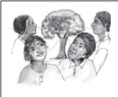
ਜੰਗਲ ਜੀਵਨ ਹੈ

ਸੰਕਲਪਨ 'ਜੰਗਲਾਤ' ਨੂੰ ਦਰਸਾਉਂਦਾ ਪੋਸਟਰ। 'ਜੀਵਨ ਵਿਗਿਆਨ' ਸਕਦਾ ਹੈ?