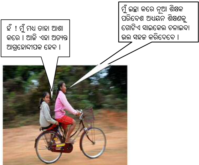
ଚିତ୍ର : ଦୁଇଜଣ ଝିଅ ନୁଆ ପରିବେଶ ଅଧ୍ୟୟନ ଶିକ୍ଷକଙ୍କୁ ଭେଟିବା ଆଶାରେ ବିଦ୍ୟାଳୟକୁ ସାଇକେଲ ଚଳାଇ ଯାଉଛନ୍ତି ।

ଶିକ୍ଷଣ ଏକ ନିରନ୍ତର ପ୍ରକ୍ରିୟା, ସେହି ଦୃଷ୍ଟିରୁ ଶିକ୍ଷଣର ଆକଳନ ହେବା ଉଚିତ । ଶିକ୍ଷଣରେ ଶୂନ୍ୟତା ଓ ଅସୁବିଧା ଗୁଡ଼ିକୁ ନିରୂପଣ କରିବାରେ ଆକଳନ ଶିକ୍ଷକଙ୍କୁ ସାହାଯ୍ୟ କରେ । ଦୃଷ୍ଟିଗୋଚର ହେବା ମାତ୍ରେ ଯଦି ଏଗୁଡ଼ିକୁ ଧ୍ୟାନ ଦିଆଯାଏ ତେବେ ଶିକ୍ଷଣ ପ୍ରକ୍ରିୟାକୁ ଦକ୍ଷ ଓ ଫଳପ୍ରସ୍ତ କରାଯାଇ ନିମିତ୍ତ ଶ୍ରେଣୀ ଆକଳନକୁ ଦୂରାନ୍ୱିତ କରାଯିବା ଉଚିତ । ତେଣୁ ଉତ୍ତମ ଆକଳନ ପ୍ରକ୍ରିୟା ଧାରାବାହିକ ହେବା ଉଚିତ୍ ।