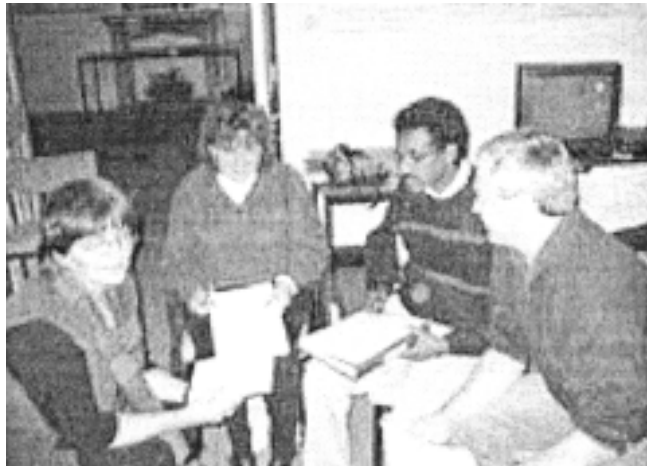
আন্তঃৰাষ্ট্ৰীয় NGO প্ৰশিক্ষণ আৰু INTRAC প্ৰশিক্ষণ (a) গৱেষণা কেন্দ্ৰ

ৰাষ্ট্ৰসংঘৰ বিকাশ আচনিৰ (UN Development Programme UNDP) মতে দক্ষতা/সামৰ্থতা হৈছে— কাৰ্য কৰা, সমস্যা সমাধান আৰু প্ৰবাহিত ধাৰা অনুযায়ী নিৰ্দ্ধাৰিত উদ্দেশ্যসমূহত উপনীত হোৱাৰ বাবে থকা এজন ব্যক্তি, অনুষ্ঠান আৰু সমাজৰ এটা সামৰ্থতা। দক্ষতা নিৰ্মাণ আৰু দক্ষতা বিকাশে, মানুহ আৰু আনুষ্ঠানিক স্থাপন কৰা কাৰ্যক সূচায়।