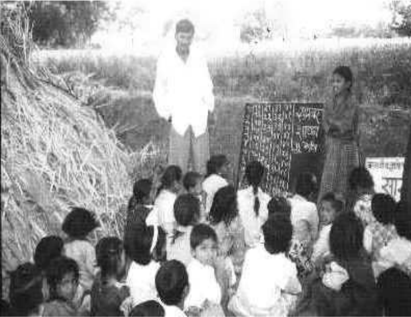
શેરડીના ફાર્મ ઉપર શક્કર શાળા

આ પ્રકારની સમસ્યાઓના સમાધાન માટે મહારાષ્ટ્ર સરકારે ૨૦૦૧ માં વિચરતાં બાળકોનો અભ્યાસ ચાલુ રહે તે માટે શક્કર શાળાઓનો આરંભ કર્યો. આ શાળાઓ સંપૂર્ણ વર્ષ દરમ્યાન ચાલુ રહેતી નથી પરંતુ શરૂઆતમાં જ ચાલે છે. સામાન્ય રીતે વિદ્યાલય ઉનાળાની રજાઓ પછી જૂન મહિનાના આરંભમાં શરૂ થાય છે. શેરડીના પાકની ઋતુમાં આવા કામદારો ફેક્ટરીની નજીકના સ્થળે રહે છે. આવા સમયે તેમનાં બાળકો શાળામાં જઈ શકતા નથી. શક્કર શાળામાં સ્થળાંતર સમયે આ બાળકો માટે શેરડીની ફેક્ટરી વર્ગો શરૂ કરવામાં આવે છે. આ વિદ્યાલયોને બીજું સમેસ્ટર વિદ્યાલય કહેવામાં આવે છે.