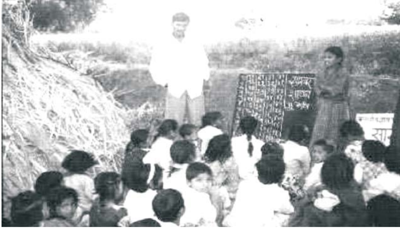
అరుణయట - పాఠశాల

ఈ అధ్యయనం ద్వారా సార్వజనీన ప్రాథమిక విద్యను (UEE) ఈ కిందివిధంగా నిర్వచించవచ్చు.