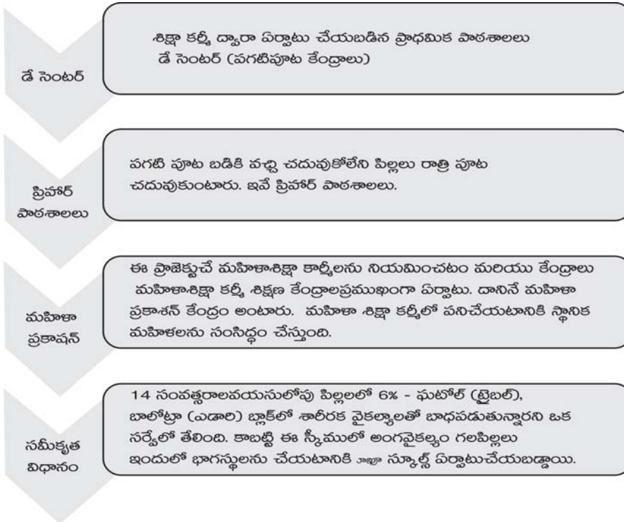
పటం : 5.3 శిక్షా కర్తృ ముఖ్య కార్యకలాపాలు

కార్యకలాపాలు: ఈ క్రింది పటంలో (5.3) ఈ ప్రాజెక్టుచే నిర్వహించబడు కార్యకలాపాలు లికార్లు చేయబడినాయి.